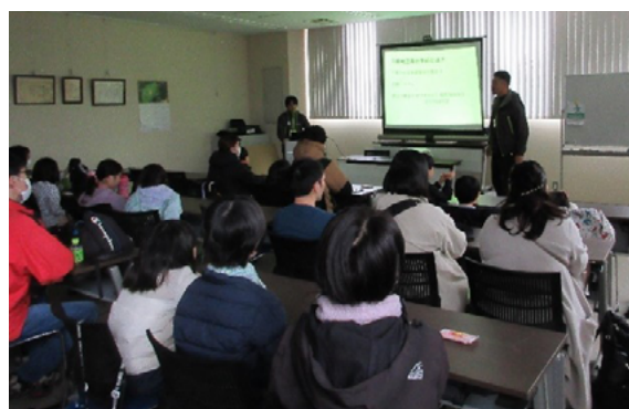
青壮年部による農地機能の授業

本イベントは、①講義による情報提供、②農地への避難体験、③地元生産者が栽培した野菜を用いた炊き出しという3段階の構成をとっている。これにより、参加者に対して、災害時の避難場所としての機能や食料供給の機能など、農地の防災機能を多角的に伝えることができる内容となっている。