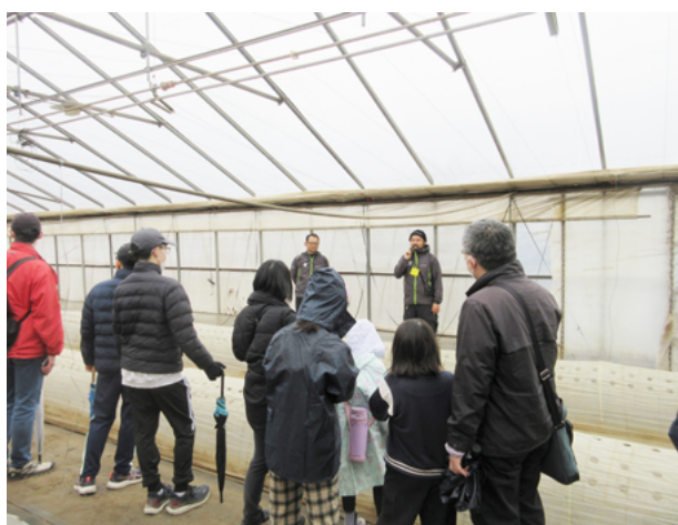
「農業×防災イベント」の様子。非常時の農地避難体験として、ビニールハウスの中に入り、暖かさを体感している

組合員や地域住民と日常的な接点を持ち、そのニーズに応じてきたJAや組合員組織は、こうした防災のニーズに対しても、組合員活動や行政をはじめとする他団体との連携を通じて応えてきた。そして、防災は誰もが関心を持つ普遍的なテーマであるからこそ、総合事業を展開するJA、および地域のために活動する組合員組織にとって、この活動を入り口として、地域住民との新たな接点を構築で