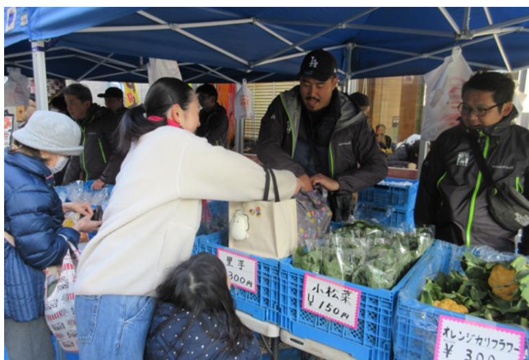
駅前での農作物直売会

同部の役員構成は、部長、副部長、会計、監事、専門部会長、専門副部会長、専門部会員、地区役員で、合計34名となっている。このうち、専門副部会長までの役員が幹部役員と位置づけられている。専門部会とは、青壮年部内に設置されている営農部会、組織部会、農政部会の3部会を指す。営農部会は市民への都市農業PRを目的とした農産物直売会を市内で開催し、組織部会は各種イベントの広報活動を担当している。農政部会では、相続税対策に関する講習会(農政講習会)を開催するなど、営農継続における制度的課題に関する知識向上を図っている。この3部会がそれぞれの役割を発揮することで、都市農業に関する情報発信を効果的に行うことが可能になっているという。