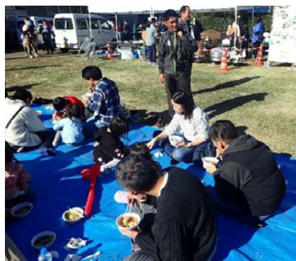
地元野菜を使用した炊き出し