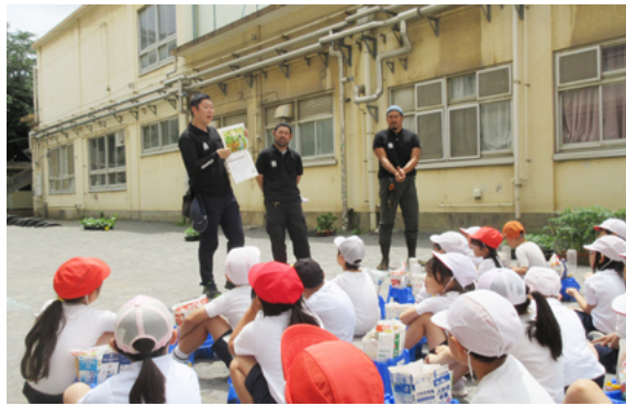
ゲストティーチャーによる出前授業の様子