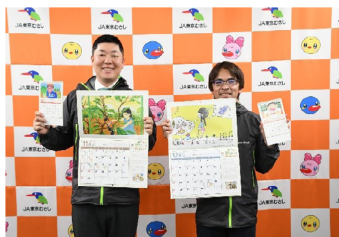
完成したカレンダーと青壮年部員

これらの取り組みは、「農地を次世代に引き継ぎたい」という青壮年部員の強い思いに基づいて展開されている。市内の子どもたちに農業を身近に感じてもらうことは、将来の都市農業理解者の育成につながるだけでなく、子どもたちの保護者、農のある風景画や食育カレンダーを目にする地域住民全体に対しても、都市農業の重要性への理解を広げることにつながっていると考えられる。