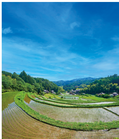
茨木市長谷地区の 棚田

西上： ご承知のように、JRや阪急の駅に近いところは都市化されていますが、北部に行くほど中山間地、山間地が広がり、いちばん高いところで標高680mに達します。その向こう側は大阪府豊能町と京都府亀岡市です。