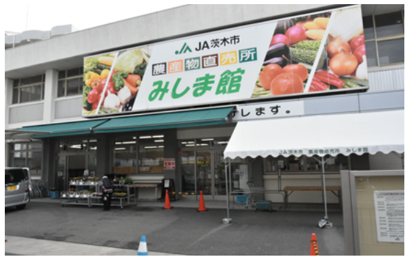
駅近で立地がよく、スーパーなどが立ち並ぶ激戦区だ

一方、若葉塾は営農塾には参加がむずかしい方、年齢的には40歳前後で、お勤めの関係上、土曜日限定で参加できるような方を対象としています。若葉塾はサポーター育成というか、初心者入門という位置づけになります。